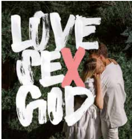
32 Liebe, Sex und Gott