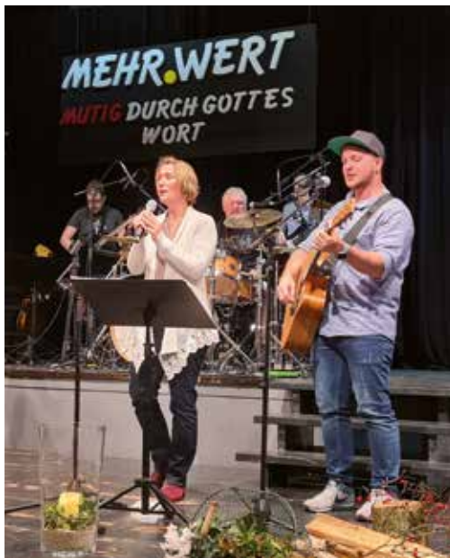
25 Neues wagen – die Einheit wahren