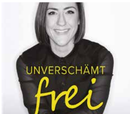
34 Christine Caine: Schluss mit der Scham

34 Christine Caine: Schluss mit der Scham Rita Bially