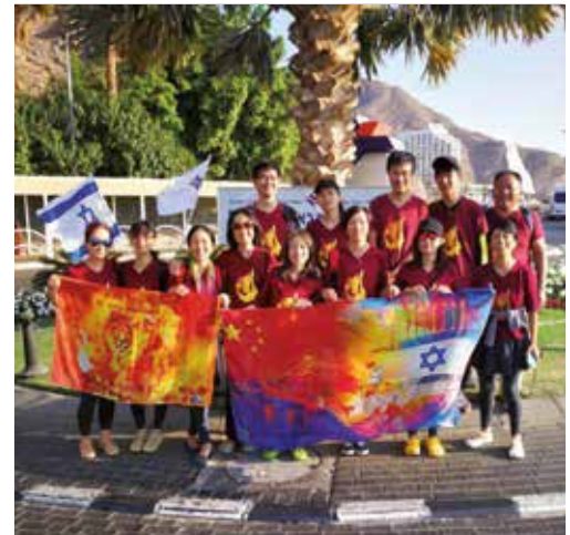
35 Back to Jerusalem